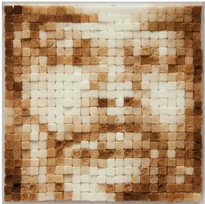
Píxeles , 2003. Courtesy of the artist