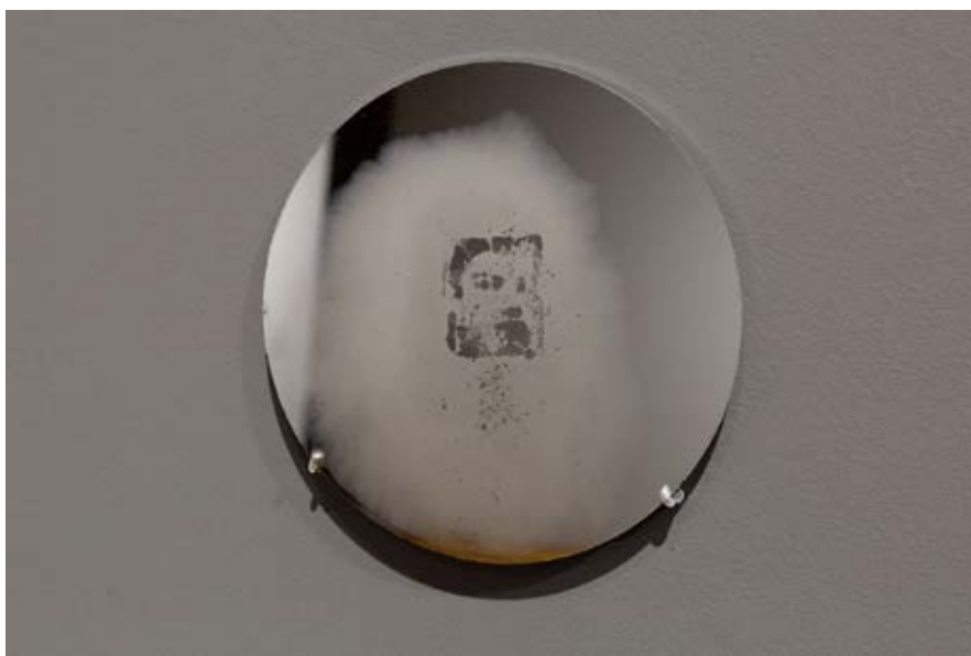
Aliento , 1999.

→ Vad tänker och känner du när du upplever det här verket?