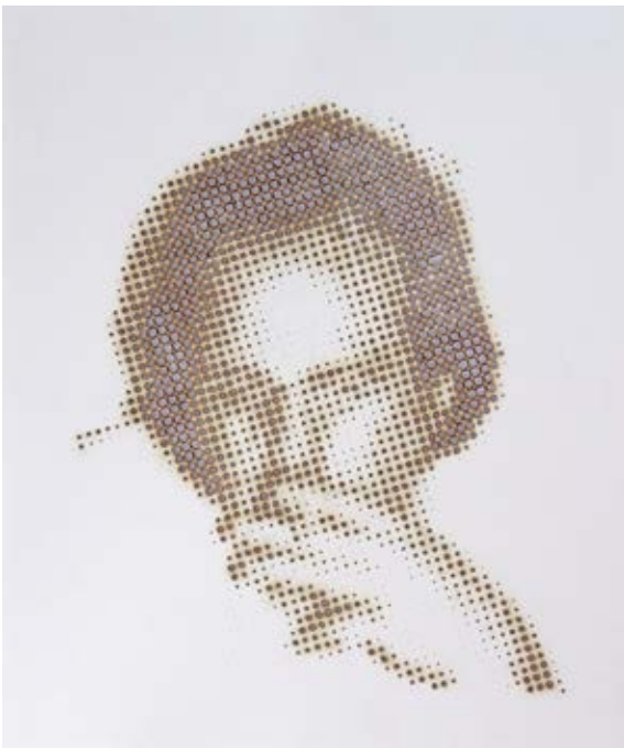
Intervalos (mientras respiro), 2004.

Hans konstnärliga arbete kretsar kring tid, minne och politiska frågor som ofta refererar till Colombias nyare historia. Genom sina verk visar Oscar Muñoz att alla människor delar en föränderlig och flyktig tillvaro. Hans arbete engagerar betraktaren i installationerna, som reflekterar över att ingenting är permanent – inte ens fotografiet.