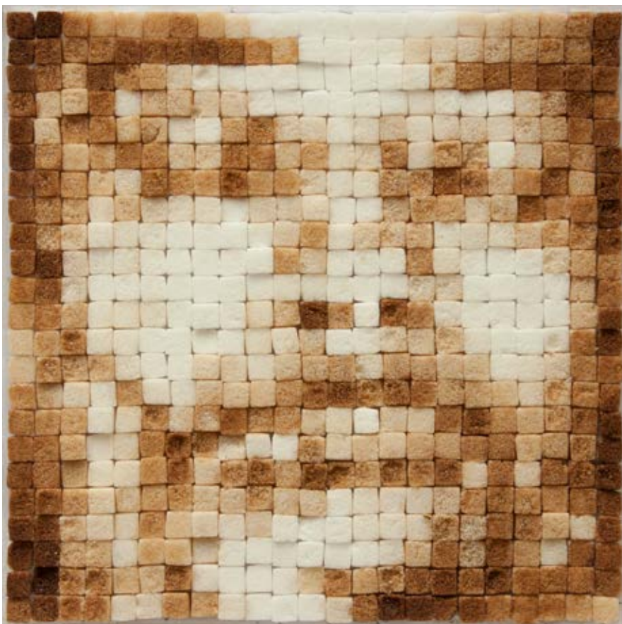
Pixelles , 1999–2000.

Elementet anonymitet är viktigt för verket, ge därför eleverna en möjlighet att tillsammans reflektera kring vad anonymitet kan betyda inför deras eget arbete. Be eleverna skriva ut en svartvit porträttbild med förstärkt kontrast som underlag för porträttet. Det går att förändra kontrasten hos en bild enkelt med hjälp av olika filterfunktioner på elevernas telefoner eller surfplattor. Be dem därefter rita upp ett ruttmönster över utskriften som underlag för pixlingen i socker. Sockerbitarna färgas lättast med hjälp av snabbkaffe, vilket gör det lättare att öka mängden kaffe i vattnet för en mörkare nyans. Prova gärna att experimentera med andra drycker för att få fram olika färger.