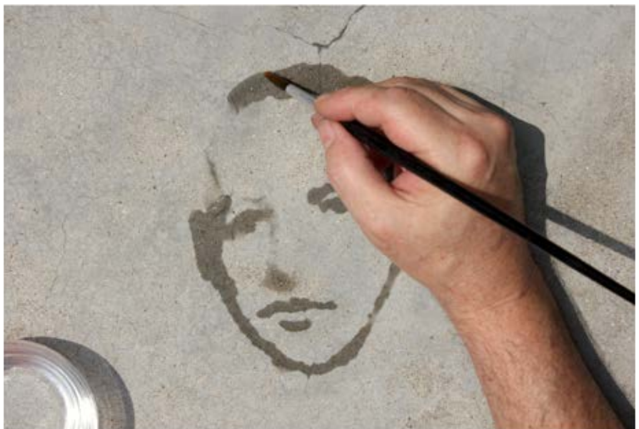
Stillbild från video, Re/trato , 2004.

Se verket genom att besöka vimeo.com/31566122 eller använd QR-koden.