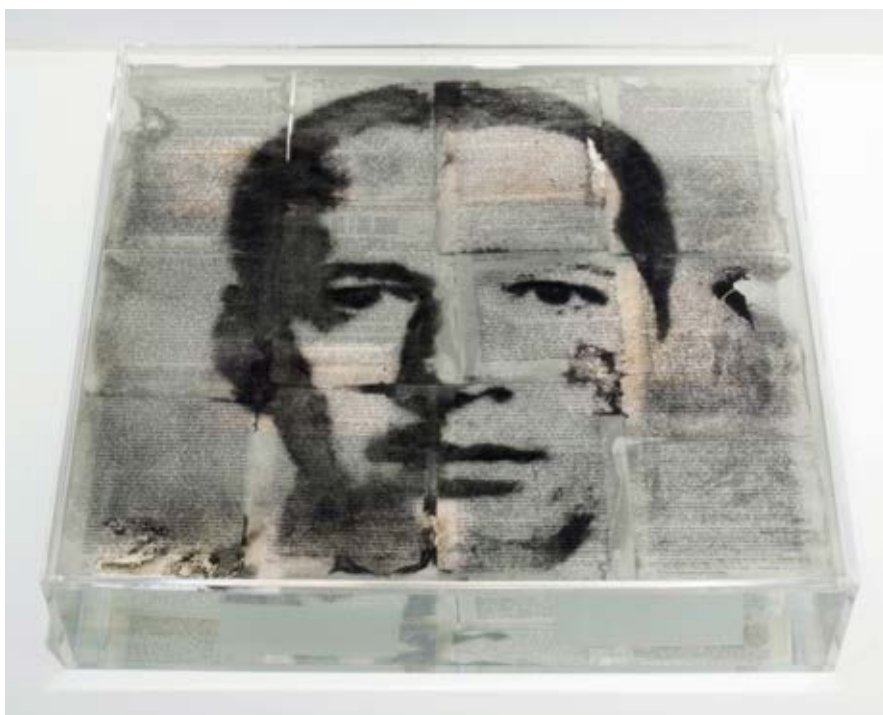
Narcisos , 1995–2011. Courtesy of the Philadelphia Museum of Art © Constance Mensch