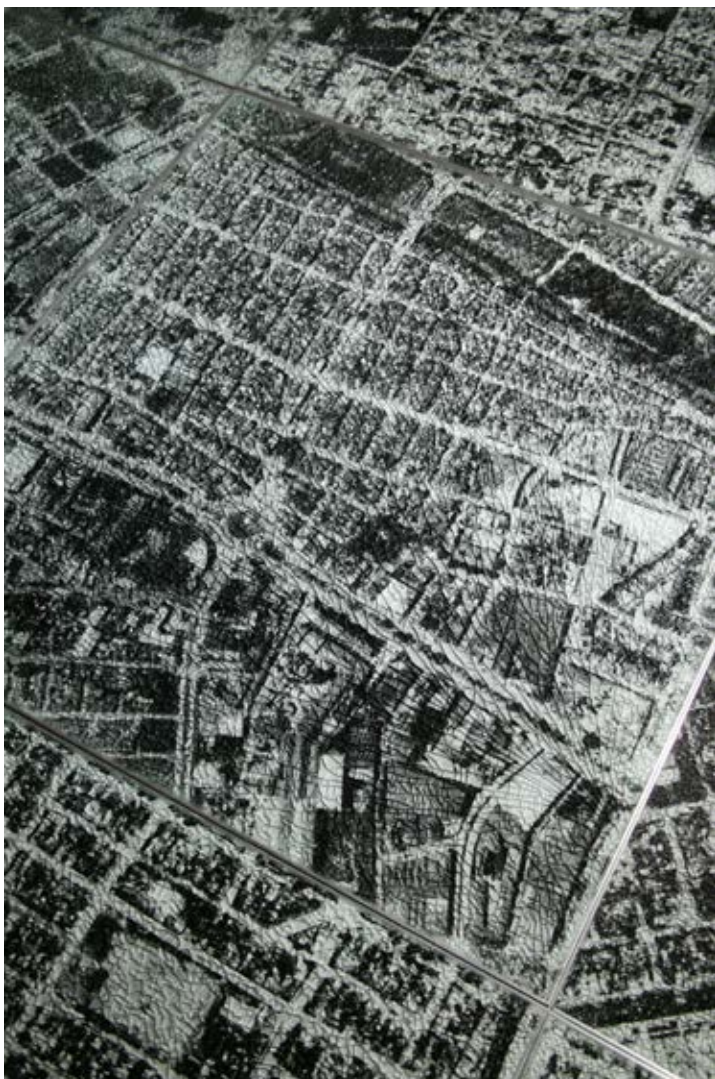
Ambulatorio , 2003/2008. Courtesy of the Sicardi Gallery

Under 1980- och 1990-talet drabbades Colombia hårt av kriget mellan stridande drokarteller och den colombianska regeringen. Detta har varit ett viktigt ämne för Muñoz arbete. Verket Ambulatorio inspirerades av ett bombdåd i Cali under den pågående konflikten. När konstnären promenerade genom Cali efter bombdådet blev han häpen över den stora mängd glassplitter som täckte trottoarerna. Hans installation Ambulatorio består av flygfoton av staden Cali som ligger under säkerhetsglas. När besökarna går på glasgolvet och tittar på staden uppifrån splittras glaset av tyngden och tränger in i bilden.