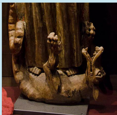
En arg drake