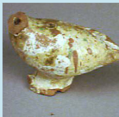
En gök (utan huvud)