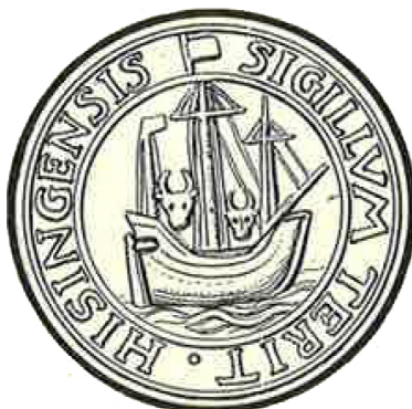
En ko (som åker båt)