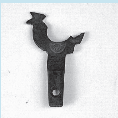
En mycket liten tupp